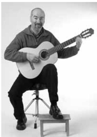
La position classique

Particulièrement en musique pop et rock, on joue de la guitare debout, à l'aide d'une sangle pour guitare. Veille à ce que l'instrument ne pende pas trop bas, car sinon, tu risques d'avoir des problèmes en jouant les accords. Si tu ne peux pas fixer de sangle à ta guitare, tu peux fixer la guitare entre la saignée du bras et le haut de ton corps. Il faut certes s'exercer un peu pour pouvoir jouer dans cette position.