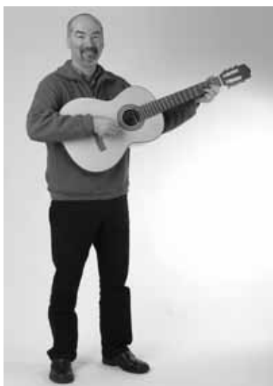
La position debout

De nombreux guitaristes préfèrent s'asseoir lors de longues séances d'exercices. Tu peux simplement placer la guitare sur ta jambe droite et la maintenir en position en y appuyant le bras droit. Quand tu croises les jambes, tu peux appuyer la guitare sur la jambe qui se trouve au-dessus.