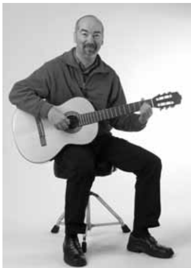
La position décontractée